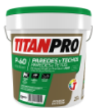
P-60 - Pintura Vinílica Premium

Proyecto Edificio de Oficinas Albarracín 34